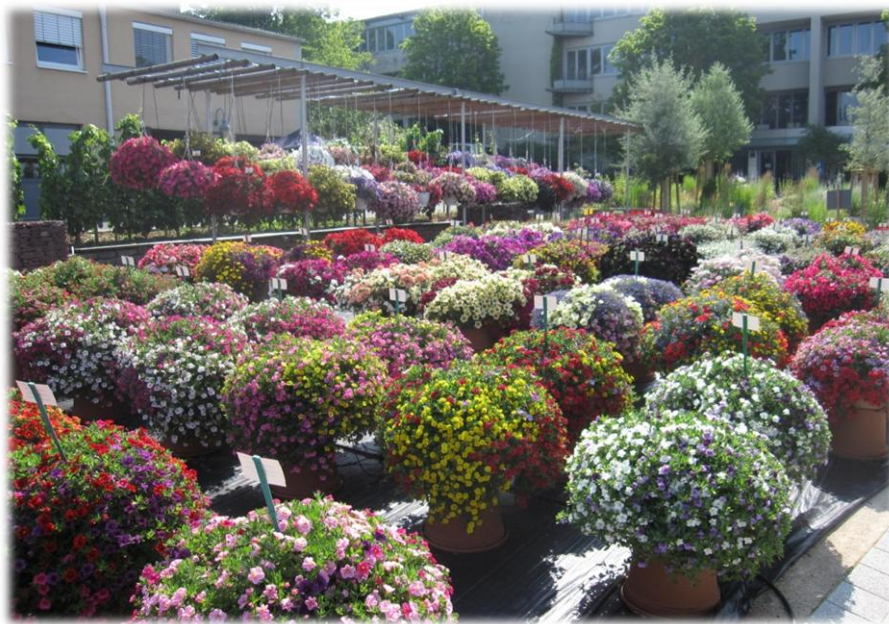
Das Blütenmeer der Beet- und Balkonpflanzenprüfung der Abteilung Gartenbau sorgte für große Bewunderung.