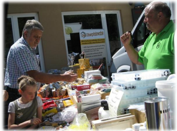
Es herrschte reges Treiben – sowohl vor der Imkerei als auch bei der Abfüllung im Schleuderraum des Fachzentrums