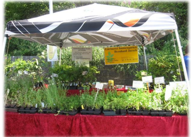
Zum ersten Mal dabei: Der Immengarten Jaesch mit einem vielfältigen Angebot an Bienenweidepflanzen