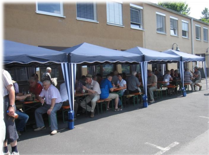
Viele Gäste nutzten das Imbissangebot für eine Pause und ein Fachgespräch